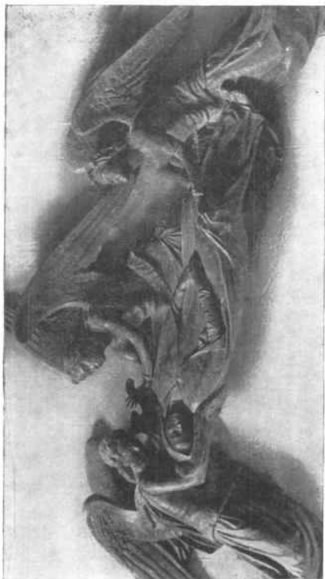
Francesco Nagni: L'Assunta

Ci fu ancora un lungo periodo di sosta; ma il Padre Minozzi non poteva rinunciare al compimento di quest'opera che avrebbe completato tanto degnamente l'Istituto prediletto. Coerente con le sue aspirazioni, che di proposito abbiamo riferito all'inizio, Egli passò a commissionare le opere d'arte occorrenti.