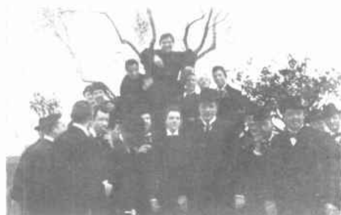
Una singolare posa di Padre Semeria, sopra un alberello, tra un gruppo di amici, il 19 aprile 1897. È l'epoca del Quaresimale in San Lorenzo in Demaso.

"Meno pensoso del Toniolo — afferma Padre Minozzi — meno acuto e tagliente del Murri, fu il maestro più amato e più popolare, il più simpatico, il vero padre delle giovani generazioni".