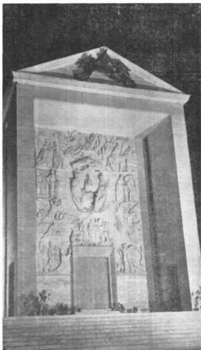
La monumentale chiesa dell'Istituto Maschile di Amatrice opera di Arnaldo Foschini Altorelievo di Alessandro Monteleone

Il 24 marzo scorso ha chiuso serenamente la sua operosa vita il