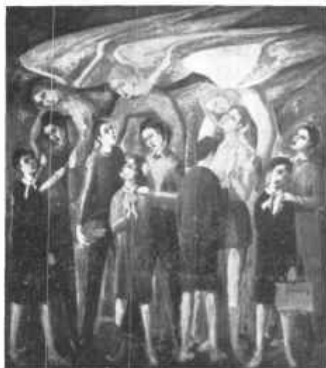
SAVINIO UNGHERI — Angeli e fanciulli