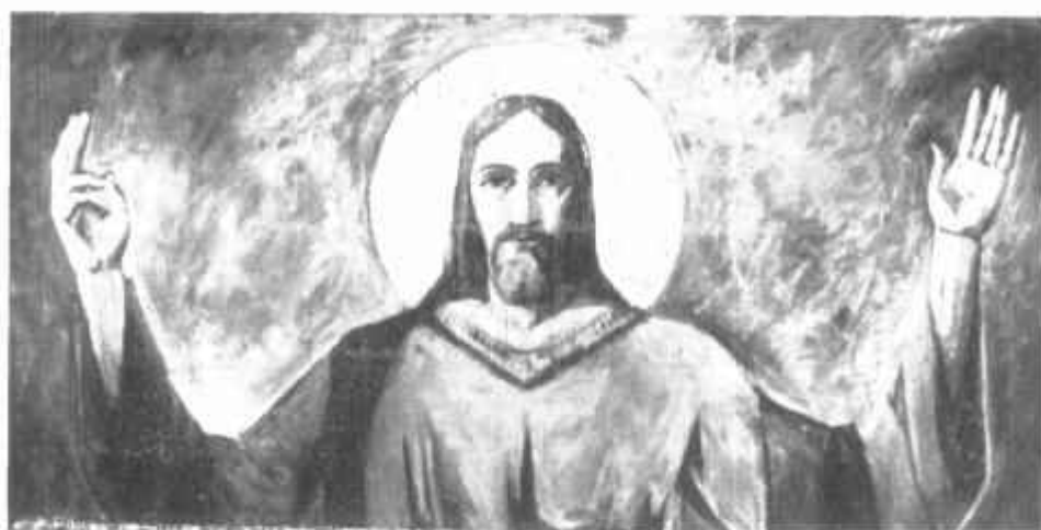
SAVERIO UNGHERI — Il Cristo benedice

sacra, dove il sentimento, più che la tecnica, deve far da guida alla sensibilità del pittore.